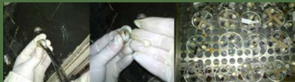
Preparácia šošovky z očnej bulvy a následná príprava na sušenie.

o pomerne malú vzorku, ale neskoršie snád' budeme môcť vysloviť závery o selektívnosti sokoliarskeho lovu.