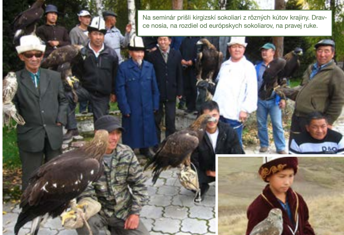
Na seminár prišli kirgizskí sokoliari z rôznych kútov krajiny. Dravce nosia, na rozdiel od európskych sokoliarov, na pravej ruke.