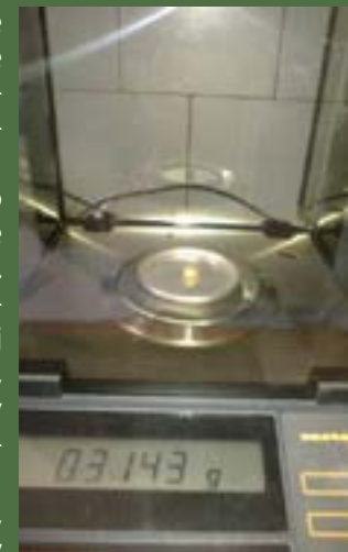
Ukážka váženía šošoviek