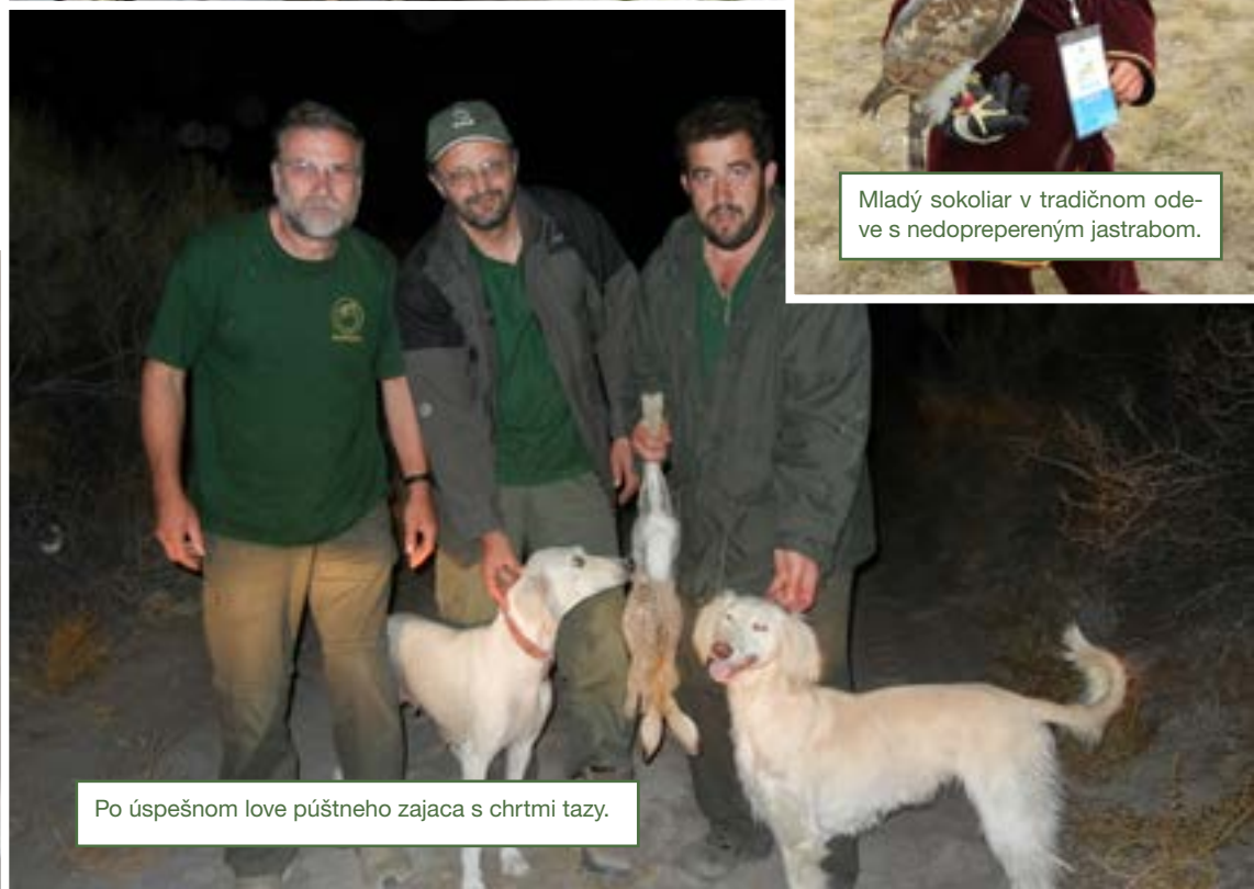
Po úspešnom love púštného zajaca s chrtmi tazy.